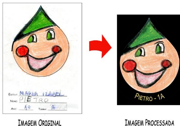
Figura 1 - Tratamento das imagens:

Como essa publicação será possível? As crianças irão fazer suas ilustrações em uma folha de papel onde há um desenho em forma de gota ou “pinguinho”. Essas ilustrações serão posteriormente digitalizadas e diagramadas no corpo do livro, em páginas especialmente destinadas a isso (Vide Figura 1 e 2). Cada “pinguinho” terá em sua parte inferior o nome e turma de seu autor, a fim de que o trabalho de cada ilustrador possa ser identificado. Na capa irá constar a frase “Edição Especial Escola ... – Ano de publicação”. O lançamento do livro irá ocorrer em um evento a ser realizado na escola.